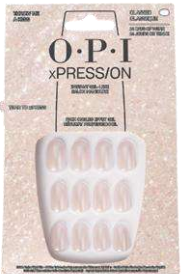
Throw Me a Kiss