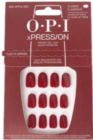
Big Apple Red